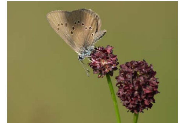
Der Dunkle Wiesenknopf-Ameisenbläuling benötigt artenreiche Wiesen mit dem Großen Wiesenknopf als Lebensraum.

Eldorado für zahlreiche Insekten, darunter der seltene Dunkle Wiesenknopf-Ameisenbläuling.