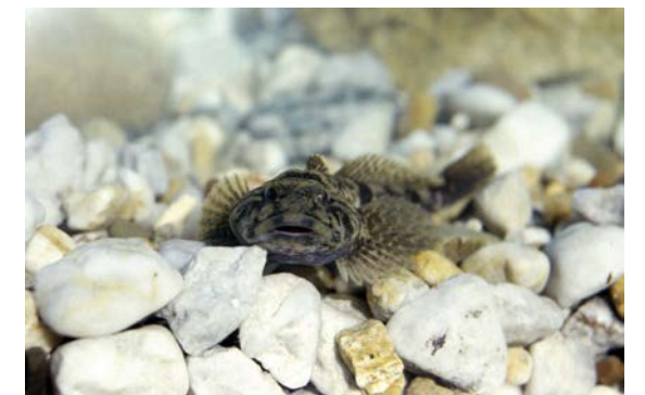
Die Mühlkoppe ist eine charakteristische Art der Forellenregion und kommt in der Schorgastaue vor.

Im Gegensatz zur Aue sind die flachgründigen Muschelkalkhänge oberhalb des Weißen Mains und bei Kauerndorf von Trockenheit geprägt: Hier gedeihen bunte Salbeiwiesen und blütenreiche Kalkmagerrasen mit vielen seltenen Arten. Eindrucksvolle Heckenzüge prägen weithin das Landschaftsbild. Diese historische Kulturlandschaft zeugt von der bäuerlichen Land- und Waldwirtschaft im Gebiet.