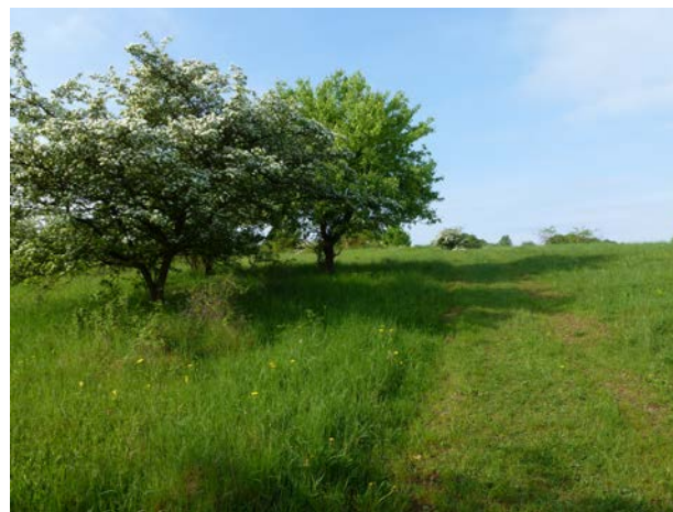
Frühlingserwachen auf der Bocksleite westlich von Trebgast

Das NATURA 2000-Gebiet beherbergt mit der Schorgastaue und der Weißmainaue einerseits und den besonnten Muschelkalkhängen andererseits recht unterschiedliche, aber gleichermaßen bedeutsame Lebensräume. Vielen Arten dient das Gebiet als Biotopverbund und wichtiger Trittstein zwischen den NATURA 2000-Gebieten im Südosten (Muschelkalkhänge bei Bayreuth, Blumenau bei Bad Berneck) und dem Oberen Maintal und der fränkischen Alb im Westen.